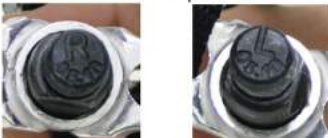
Slika 11: Leva in desna oznaka pedal