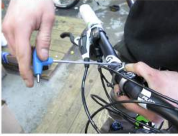
Slika 1: Montaža prednjega krmila