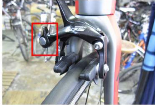
Slika 9: sproščena zavora cestnega kolesa