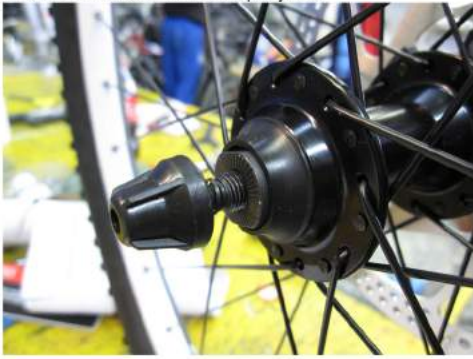
Slika 6: Pravilna vstavitev zapenjalca