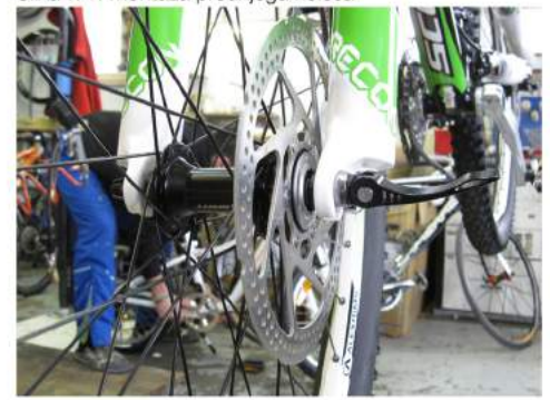
Slika 7/1: Montaža prednjega kolesa