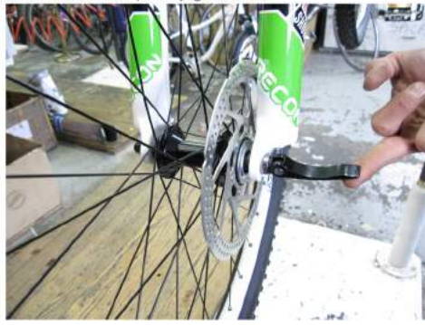
Slika 7: Montaža prednjega kolesa