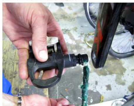
Slika 12: Nanos masti na predala