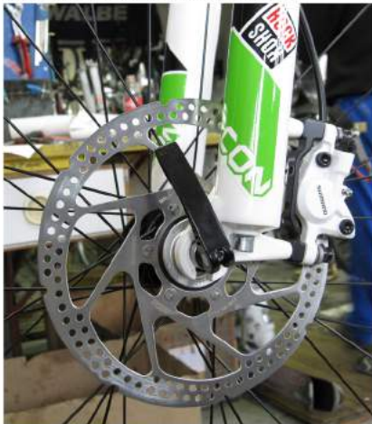
Slika 8: Pravilno zapet zapenjalac