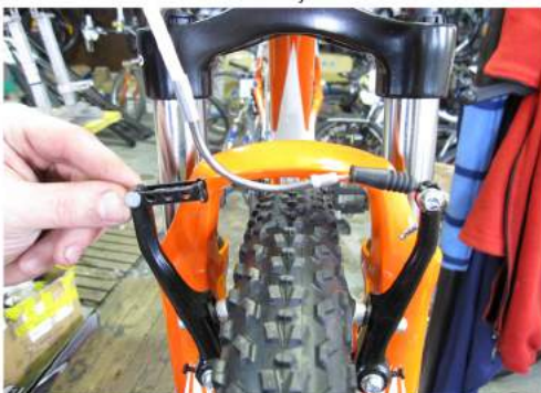
Slika 3: v-brake zavorna čeljust